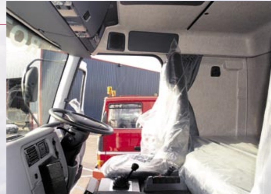
Premium cabine op hoog niveau.

MEER INFO EN FOTO'S VIND JE OP WWW.HADEL.NET.