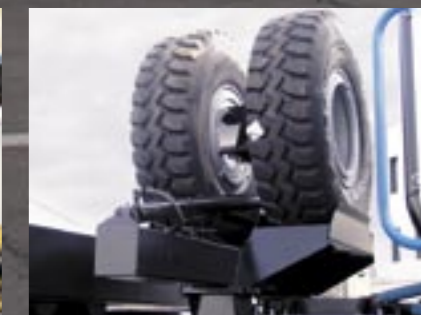
Reservewielen worden op het chassis gelierd.