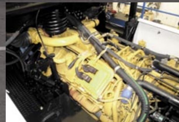
De ruim 27 liter grote CAT krachtbron.