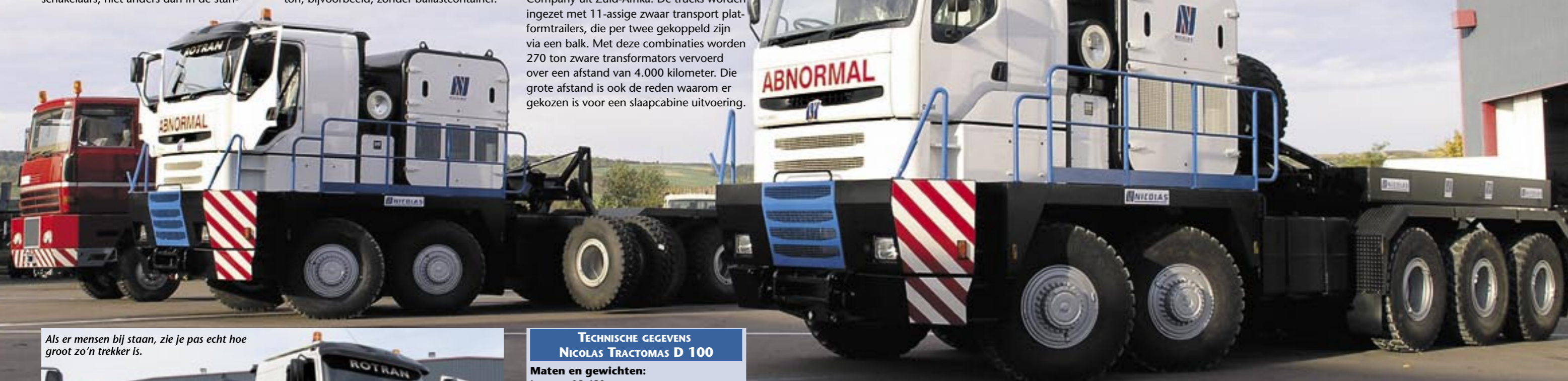
Als er mensen bij staan, zie je pas echt hoe groot zo'n trekker is.